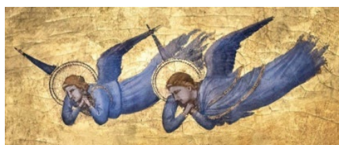
Giotto, Trippage Stiefneschi

17h45-18h00. Échanges avec les intervenants