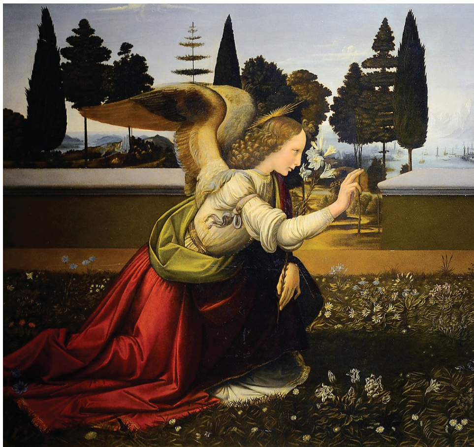
Léonard de Vinci, L'Annonciation

IRCOM UNIVERSITÉ D'ANGERS UNIVERSITÉ CATHOLIQUE DE L'OUEST MUSÉE DES BEAUX-ARTS D'ANGERS